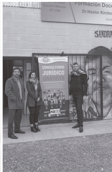
Consultorio Jurídico Cuartel V