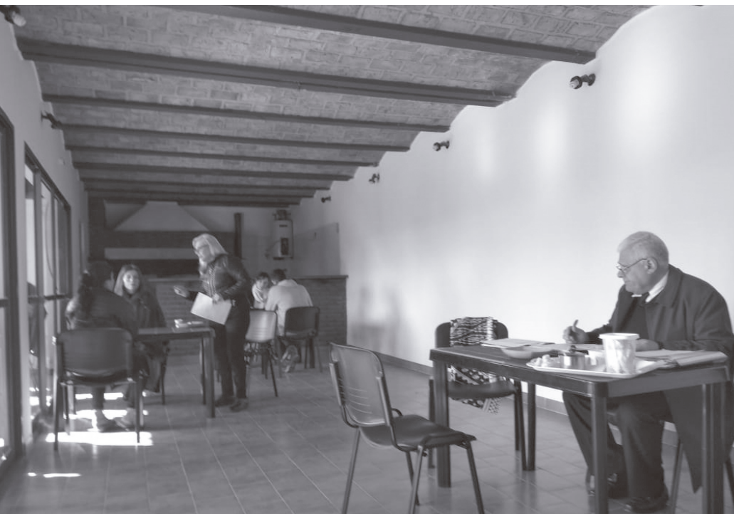
Consultorio Jurídico General Rodríguez